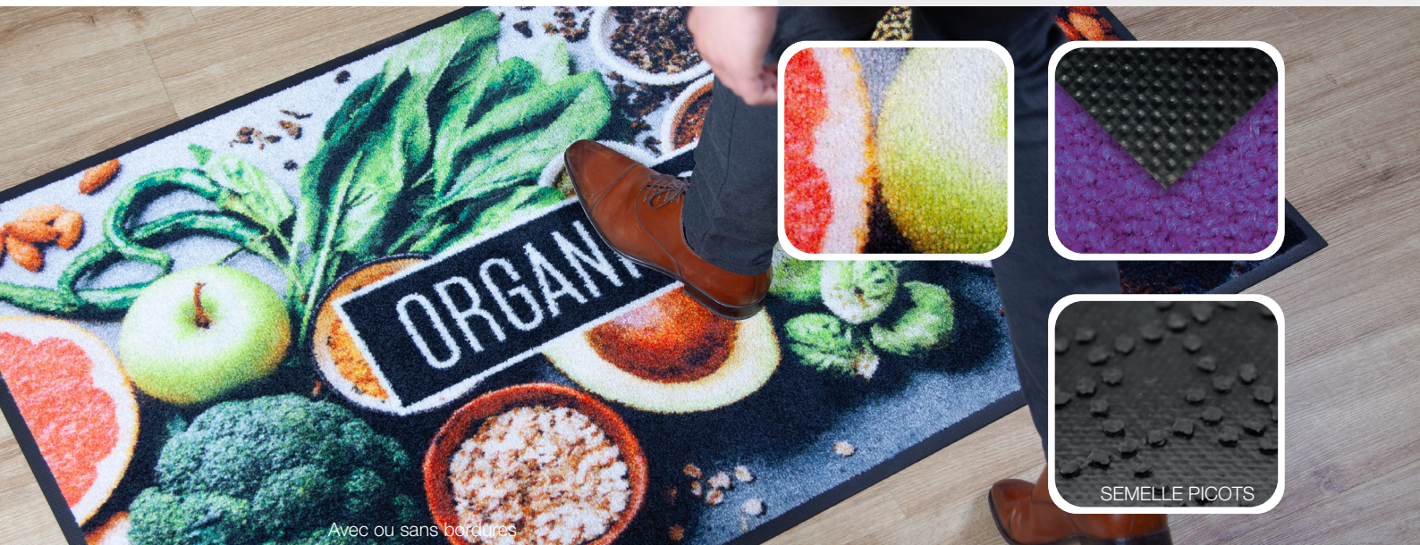
Avec ou sans bordures