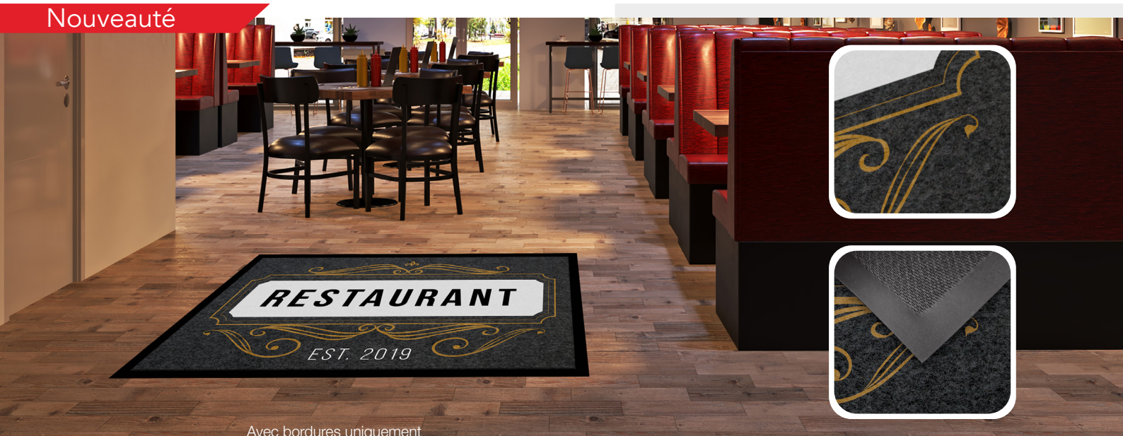
Avec bordures uniquement