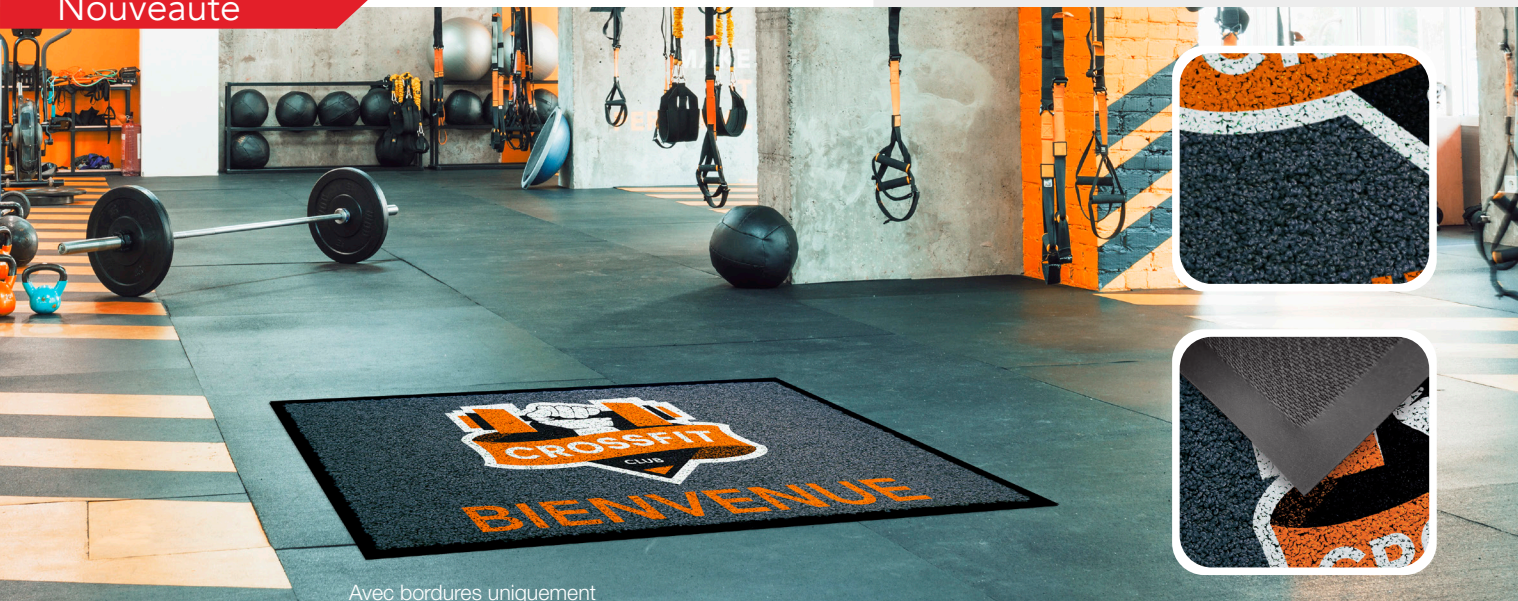
Avec bordures uniquement